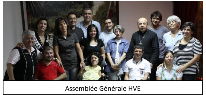
Assemblée Générale HVE

Le projet pastoral HVE – Handicap et Vie en Église, est né en l’an 2000. Il cherche à promouvoir la pastorale du « vivre ensemble » différents et complémentaires dans la paix, la joie et la sérénité, en veillant à réhabiliter les biens portants dans leur relation au monde du handicap, assurer les exigences de l’accompagnement humain et spirituel des personnes portant un handicap et leurs familles, sensibiliser et former des formateurs, et favoriser un changement personnel, structurel et institutionnel digne de révéler le vrai visage de l’Église.